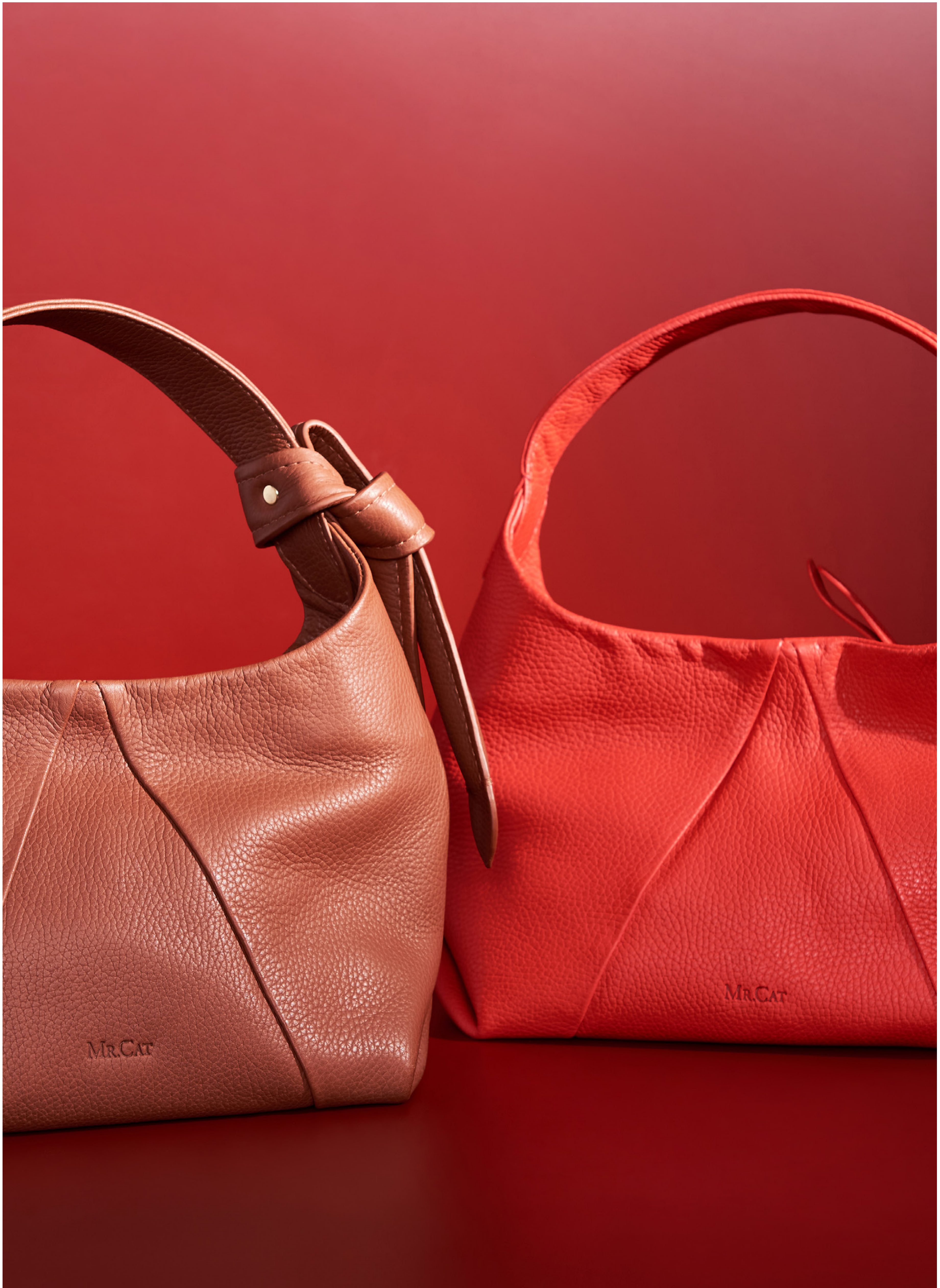
GBF015 PT|CN|RD // 759,90